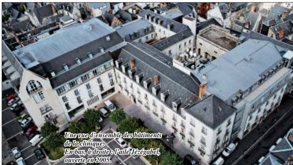
Une vue d'ensemble des bâtiments de la clinique. En bas, à droite : l'aile Jézégabel, ouverte en 2005.