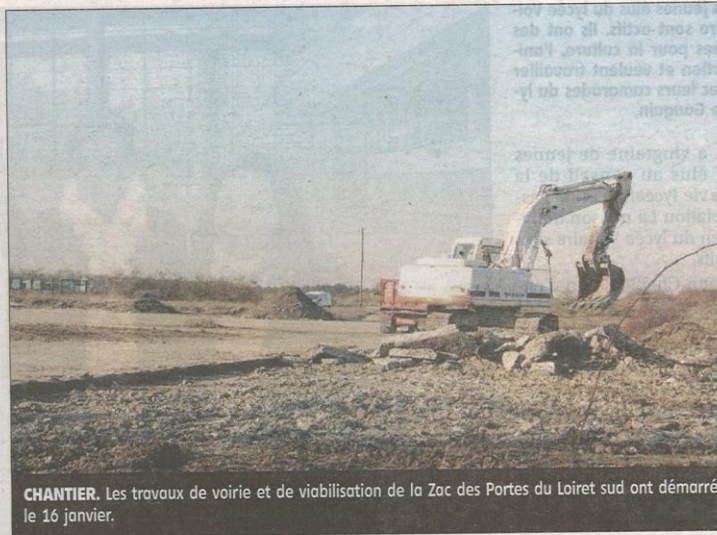
CHANTIER. Les travaux de voirie et de viabilisation de la Zac des Portes du Loiret sud ont démarré le 16 janvier.

Une première phase de travaux d'une durée de dix mois, qui consiste en pre-